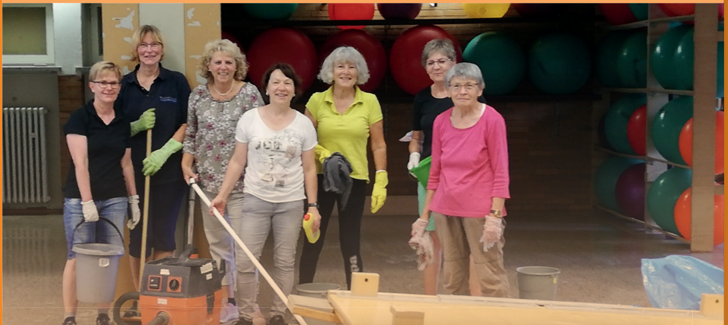
Die Damengymnastikgruppe räumt den Geräteraum auf!