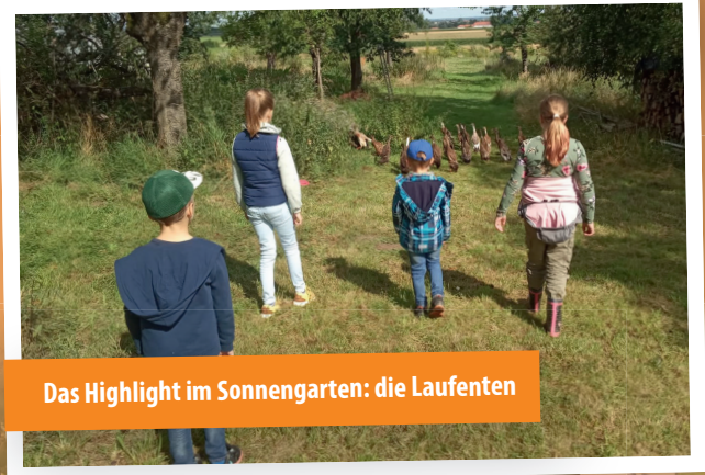
Das Highlight im Sonnengarten: die Laufenten